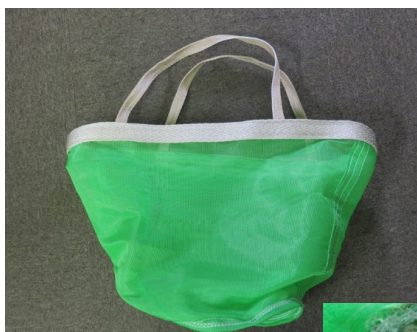
アジテータ車シュート取り付けタイプ

短繊維入りコンクリートの練混ぜ・運搬などで使用した設備を洗浄するが、その洗い水の中から混入している短繊維を分離するツール。（写真は、バルチップ社製品）