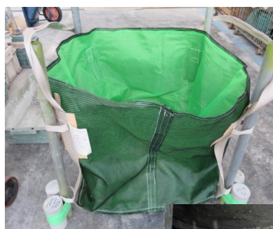
洗い場所設置タイプ(フレコン袋サ